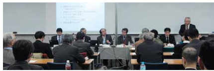
水平ワークショップ

知の共有や発展を図るとともに、種々のセキュリティ上の問題について、参加学生の皆さんが高度情報セキュリティスペシャリストとして、本質的な解決に導いていける複眼的な観点と素養を身につけていただくことも企図されています。