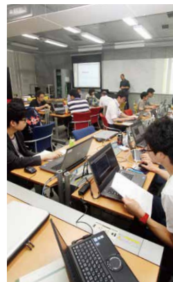
「セキュアシステム実習」

連携企業等とのインターンシップ実習または、学内における基本技術の実習によって、実践的な知識・技術を身につけます。