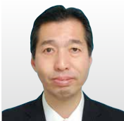
パナソニック(株) 全社 CTO 室 ソフトウェア戦略担当 理事