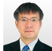
日本電気(株) ビジネスイノベーション統括ユニ 技術イノベーション戦略本部長 IoT戦略室 エグゼクティブエキスパート