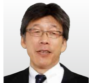
情報セキュリティ大学院大学 情報セキュリティ研究科長 教授