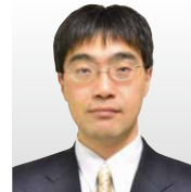
(株)日立製作所 テクノロジーイノベーション統括本部 システムイノベーションセンター セキュリティ研究部 部長