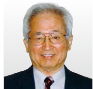
情報セキュリティ大学院大学 学長 ISSスクエア代表