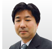
沖電気工業(株) 経済・政策調査部 部長