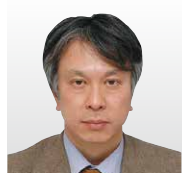
(株)KDDI研究所 執行役員