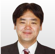
日本アイ・ビー・エム(株) 東京ソフトウェア&システム 開発研究所 クラウド開発部長