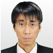
(株)富士通研究所 知識情報処理研究所 サイバー・ システムセキュリティプロジェクト プロジェクトディレクター