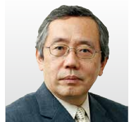
国立情報学研究所 副所長 アーキテクチャ科学研究所 教授・主幹