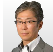
日本電信電話(株) セキュアプラットフォーム研究所 所長