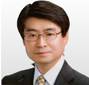
(株)東芝 研究開発センター コンピュータアーキテクチャ・ セキュリティラボラトリー 研究主幹