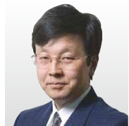
中央大学 理工学部 情報工学科 教授