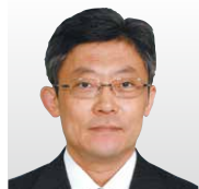
(国研)情報通信研究機構 サイバーセキュリティ研究所長