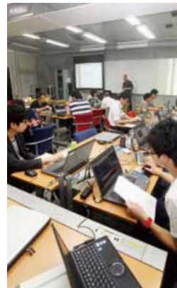
「セキュアシステム実習」

連携企業等とのインターンシップ実習または、学内における基本技術の実習によって、実践的な知識・技術を身につけます。