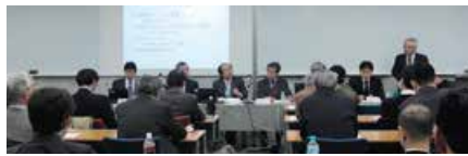
水平ワークショップ

知の共有や発展を図るとともに、種々のセキュリティ上の問題について、参加学生の皆さんが高度情報セキュリティスペシャリストとして、本質的な解決に導いていける複眼的な観点と素養を身につけていただくことも企図されています。