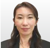
日本アイ・ビー・エム(株) 東京基礎研究所 セキュリティ&ハイブリッドクラウド イノベーション 担当部長