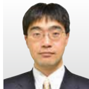
(株)日立製作所 研究開発グループ テクノロジーイノベーション統括本部 システムイノベーションセンター主管研究員