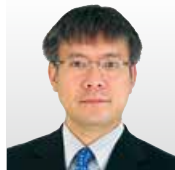
日本電気(株) 研究・開発ユニット 上席技術主幹