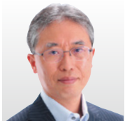
(国研)情報通信研究機構 サイバーセキュリティ研究所 研究所長