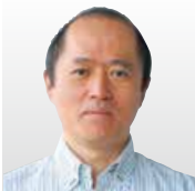
(株)富士通研究所 セキュリティ研究所長 兼 ブロックチェーン研究 センター長