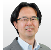
国立情報学研究所 准教授