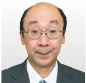
情報セキュリティ大学院大学 情報セキュリティ研究科 教授