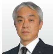
日本電信電話(株) セキュアプラットフォーム研究所 所長