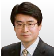
(株)東芝 研究開発本部 研究開発センター サイバーセキュリティ技術センター 技監