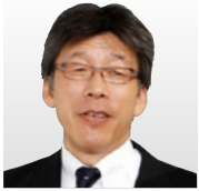
情報セキュリティ大学院大学 学長 ISSスクエア代表