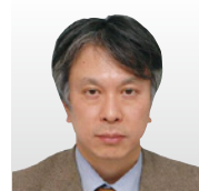
(株)KDDI総合研究所 取締役 執行役員 副所長 兼KDDI(株)情報セキュリティ本 部 情報セキュリティ フェロー