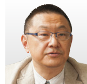
(国研)産業技術総合研究所 理事・人間工学領域 領域長