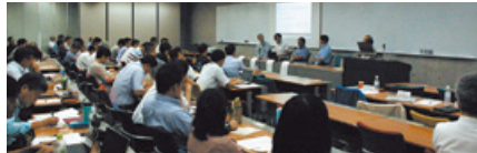
水平ワークショップ

知の共有や発展を図るとともに、種々のセキュリティ上の問題について、参加学生の皆さんが高度情報セキュリティスペシャリストとして、本質的な解決に導いていける複眼的な観点と素養を身につけていただくことも企図されています。