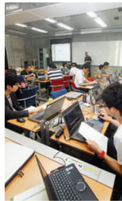
「情報セキュリティ技術演習I」

連携企業等とのインターンシップ実習または、学内における基本技術の実習によって、実践的な知識・技術を身につけます。