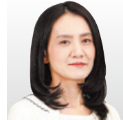
(国研)情報・システム研究機構 国立情報学研究所 教授