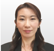
日本アイ・ビー・エム(株) 東京基礎研究所 ハイブリッドクラウド&セキュリティ 担当部長