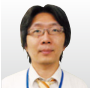
パナソニックホールディングス(株) テクノロジー本部 製品セキュリティセンター 製品セキュリティグローバル戦略部 部長