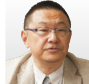
(国研)産業技術総合研究所 情報・人間工学領域 領域長