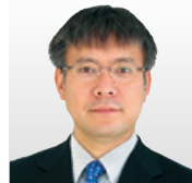
日本電気(株) グローバルイノベーション戦略部門 シニアプロフェッショナル