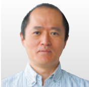
富士通(株) フェロー兼 データ&セキュリティ 研究所長