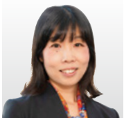
(国研)情報通信研究機構 サイバーセキュリティ研究所 研究所長