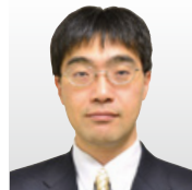
(株)日立製作所 研究開発グループ サービスシステムイノベーションセンター 主管研究員