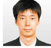
(株)KDDI総合研究所 執行役員 先端技術研究所 セキュリティ部門長