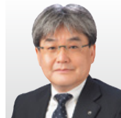
日本電信電話(株) 社会情報研究所 所長