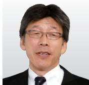
情報セキュリティ大学院大学 特別学長補佐 教授 ISSスクエア代表