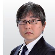
三菱電機(株) 情報技術総合研究所 情報セキュリティ技術部 グループリーダー