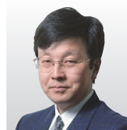
中央大学 理工学部 情報工学科 教授