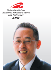
(国研)産業技術総合研究所 執行役員 情報・人間工学領域長

1997年に横浜国立大学でセキュリティ分野の研究開発を始め、2003年に同大学院工学研究科博士課程後期修了後、通信総合研究所CSL(現NICTNICT)に入所。2006年よりインシデント分析センター「NICTER(ニクター)」を核とした実践的サイバーセキュリティの研究開発に従事。博士(工学)。