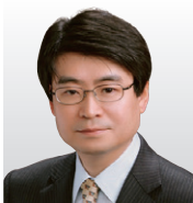
(株)東芝 総合研究所 AIデジタルR&Dセンター セキュリティ基礎研究部 エキスパート