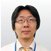
パナソニックホールディングス(株) テクノロジー本部 製品セキュリティセンター 製品セキュリティグローバル戦略部 部長