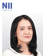
国立情報学研究所 アーキテクチャ科学研究所 教授

京都大学大学院理学研究科数学専攻修了、中央大学大学院理工学研究科情報工学専攻修了。博士(工学)。日本電気株式会社インターネットシステム研究所主任研究員を経て、2004年4月より情報セキュリティ大学院大学教授。主な研究対象領域は、暗号理論。