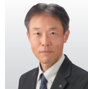
日本電信電話(株) 社会情報研究所 所長