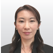
日本アイ・ビー・エム(株) 東京基礎研究所 ハイブリッドクラウド&セキュリティ 担当部長