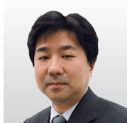
沖コンサルティング ソリューションズ(株) シニアマネージングコンサルタント