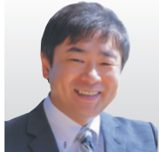
(国研)情報通信研究機構 サイバーセキュリティ研究所 研究所長