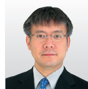
日本電気(株) グローバルイノベーション戦略部門 シニアプロフェッショナル