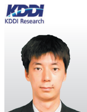
(株)KDDI総合研究所 取締役執行役員 副所長

1982年沖電気工業株式会社に入社。人工知能、自然言語処理の研究開発に従事。機械翻訳システムの開発などを経験し、1998年より、技術経営、経営戦略企画業務に従事。2019年4月より現職。