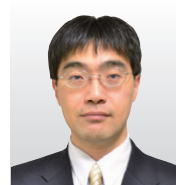
(株)日立製作所 研究開発グループ システムイノベーションセンタ 副センタ長