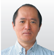
富士通(株) フェロー兼 データ&セキュリティ 研究所長