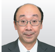
情報セキュリティ大学院大学 情報セキュリティ研究科 教授